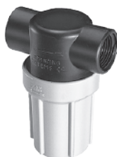
聚丙烯滤杯和滤头，10巴 1/2英寸-3/4英寸NPT或BSPT(内)