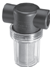
聚碳酸酯杯和聚丙烯滤头，10巴 1/2英寸-3/4英寸NPT或BSPT(内)